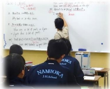
全教室に空気清浄機を設置しました。安全で快適な学習環境で指導致します。